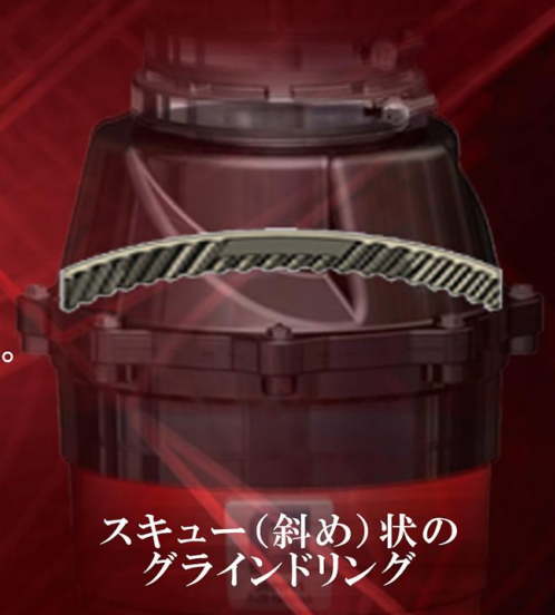
スキュー(斜め)状の グラインドリング

F-20 HardShockは世界規格に基づき卵の殻や鶏骨も楽々粉碎。繊維質の極端に強い食品以外は処理するものを選ばない圧倒的な粉碎力を誇り三角コーナー満杯の生ごみを40秒程度でスピード処理します。